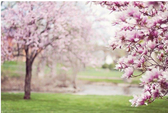
Drzewa Magnolii Wiosna Różowe