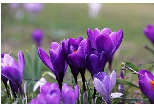
Fioletowy Krokus Ogród - Darmowe zdjęcie na Pixabay

Przyszedł dzisiaj marzec, w białych chmurek tłumie, chce pogodą rządzić nie umie! Pomaga mu zima i wiosenka młoda. Rano deszcz ze śniegiem, w południe pogoda. Nocą szczypie mroziak, że trudno wytrzymać. Sama teraz nie wiem, wiosna to czy zima?