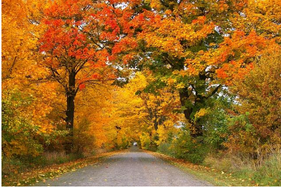
Spadek Aleja Drzewa - Darmowe zdjęcie na Pixabay

smakować będzie ? - Może dzikom, gdyby przyszły z lasu, ale dziki pewnie nie mają czasu.