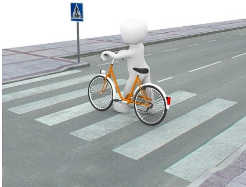
Ścieżka Kierunek Decyzja - Darmowy obraz na Pixabay