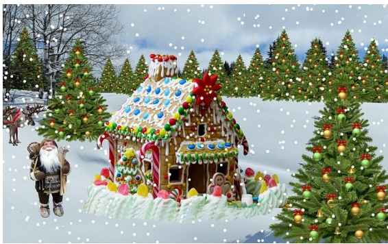
Boże Narodzenie Śnieg Choinka - Darmowe zdjęcie na Pixabay

Temat kompleksowy: Każdy może zostać Świętym Mikołajem