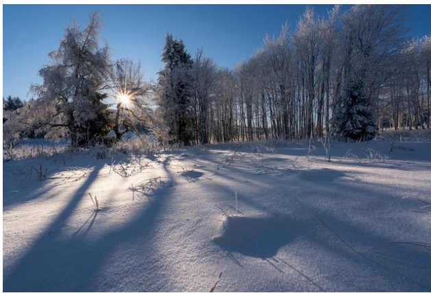
Śnieg Zima Zimno - Darmowe zdjęcie na Pixabay

Temat kompleksowy :Jak wygląda świat przed milionami lat.