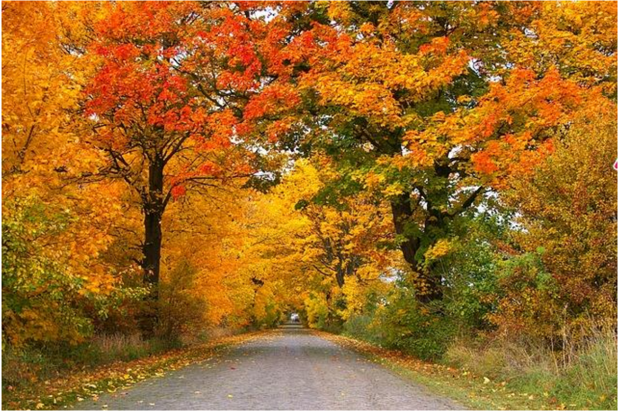
Spadek Aleja Drzewa - Darmowe zdjęcie na Pixabay

teraz wszystkie te warzywa z mamą wykopiemy. W piwniczce je przechowamy aż do końca zimy, bo sałatki i surówki chętnie z nich robimy.