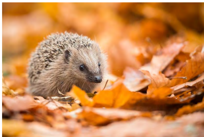
Zwierzęta zapadające w sen zimowy - lista gatunków i ciekawostki o śnie zimowym | National Geographic

„Zagadkę zadam Ci i powiedz mi, czy wiesz, Co jesienią robi wiewiórka, bocian oraz jeź?”