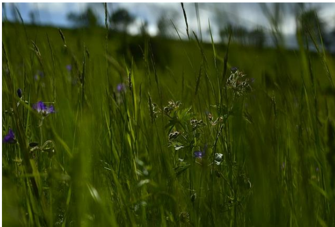
Łąka Trawy Kwiatki - Darmowe zdjęcie na Pixabay