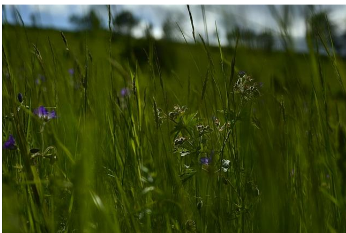
Łąka Trawy Kwiatki