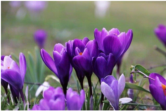
Fioletowy Krokus Ogród

Pomaga mu zima i wiosenka młoda. Rano deszcz ze śniegiem, w południe pogoda. Nocą szczybie mroziak, że trudno wytrzymać. Sama teraz nie wiem, wiosna to czy zima?