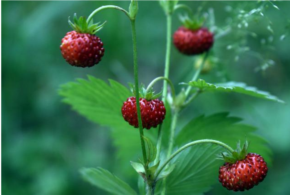
Poziomki Poziomka Natura