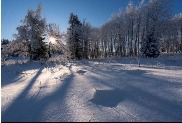
Śnieg Zima Zimno - Darmowe zdjęcie na Pixabay

Temat kompleksowy :Jak wygląda świat przed milionami lat.