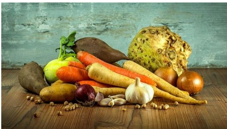
Warzywa Marchew Czosnek - Darmowe