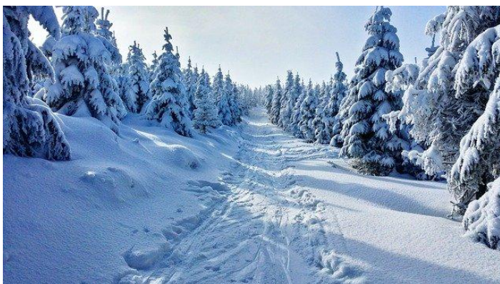
Zima Góry Śnieg - Darmowe zdjęcie na Pixabay