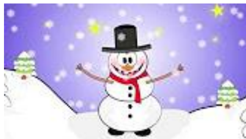
Rysunek 1. www.youtube.pl