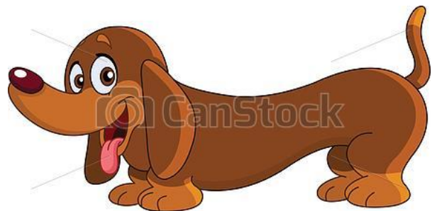
Rysunek 6: www.canstockphoto.pl