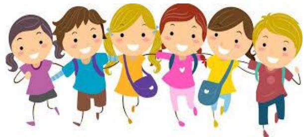
Rysunek 5: www.sowkiz5.blogspot.com

Idą rzędem przedszkolaki: raz, dwa, trzy. (bis)