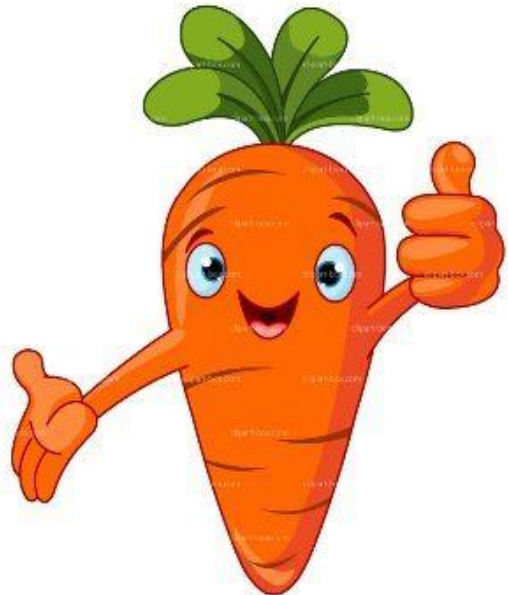
Rysunek 4: www.blogiceo.nq.pl

Wszystkie pary jarzynowe już do tańca są gotowe. Gra muzyczka, to poleczka, wszyscy tańczą już w kółeczkach. (bis)