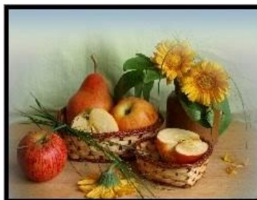
Rysunek 2: www.tapeta-wazon-gruszki-jablka-liwki-kieliszek.na-pulpit.com

Wpadła gruszka do fartuszka, a za gruszką dwa jabłuszka. A śliweczka wpaść nie chciała, bo śliweczka niedojrzała.