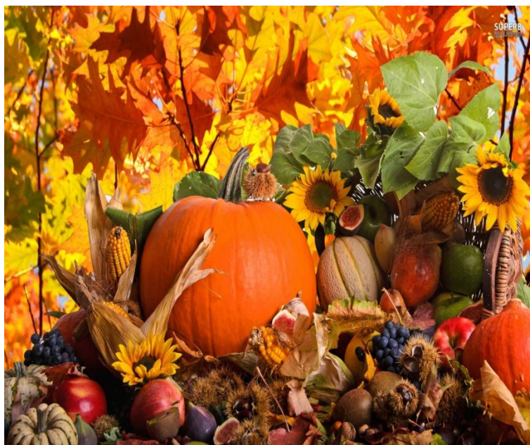
Rysunek 1: www.mamydzieci.pl

Jesienią, jesienią sady się rumienia, czerwone jabłuszka pomiędzy zielenią. Czerwone jabłuszka, złociste gruszcзки, świecą się jak gwiazdy pomiędzy listeczki. Pójdę ja się, pójdę pokłonić jabłoni, może mi jabłuszko w czapeczkę uroni. Pójdę ja do gruszy, nadstawię fartuszka, może w niego wpadnie jakaś śliczna gruszka. Jesienią, jesienią, sady się rumienia, czerwone jabłuszka pomiędzy zielenią.