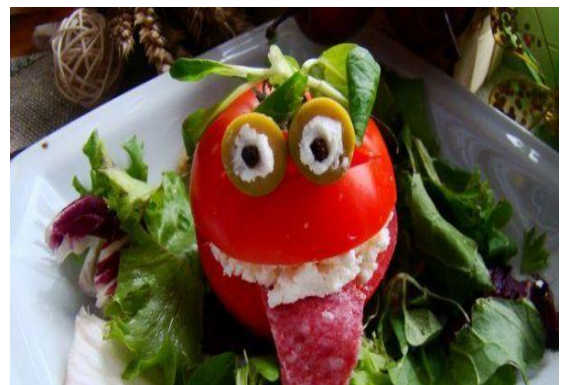
Rysunek 3: www.gotujmy.pl