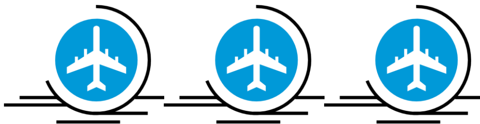
Obraz ze zbioru clipart