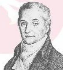
autorem słów jest Józef Wybicki napisał je w 1797 r.

Mazurek Dąbrowskiego od 26 lutego 1927 jest oficjalnym hymnem Polski