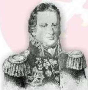
gen. Jan Henryk Dąbrowski

Marsz, marsz Dąbrowski, Z ziemi włoskiej do Polski. Za twoim przewodem Złączym się z narodem.