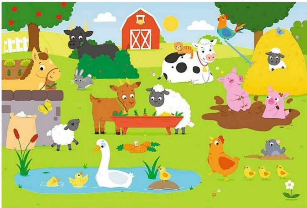
Zwierzęta na wsi - Przedszkouczek.pl