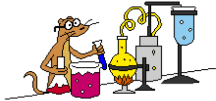
Domowe eksperymenty (zgierz.pl)

Dziadek już od roku siedzi I obmyśla odpowiedzi, Babka jakiś czas myślała, Ale wkrótce osiwiła. Matka wpadła w stan nerwowy I musiała zażyć bromu, Ojciec zaś poszedł po rozum do głowy I kiedy powróci - nie wiadomo.